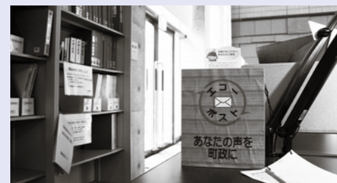
役場 1 階情報公開コーナー設置のエコポスト